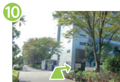
10 100mほど直進すると右手に正門があります。警備室前をそのままお通りください。