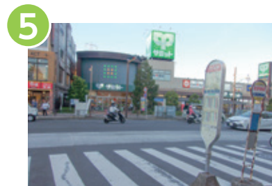
5 JR南武線をご利用の方は尻手駅で下車し、尻手駅前から臨港バスに乗車します。