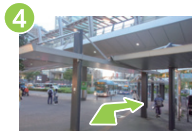
4 階段を降りて右に進み、58番のりばから臨港バスに乗車します。