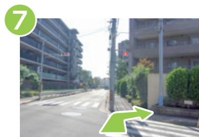
7 バスの進行方向から逆戻りし、最初の信号を渡って右折します。