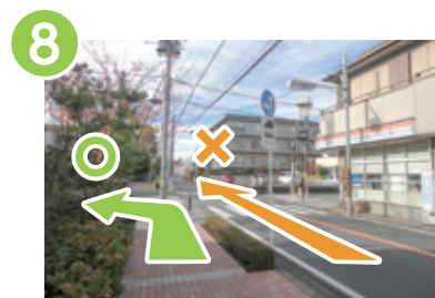
8 永井商店さんの交差点を渡ってすぐ左折します。Googleマップのゴールは直進が表示されますが、左折です！