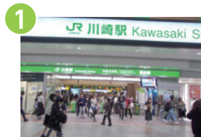
1 JR川崎駅の中央北もしくは中央南改札を出ます。