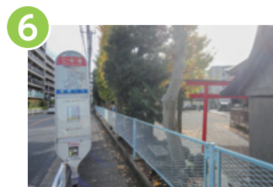
6 江ヶ崎八幡でバスを降ります。