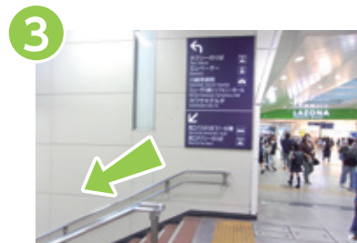
3 左手の階段を降り、西口バスのりば51～60番を目指します。