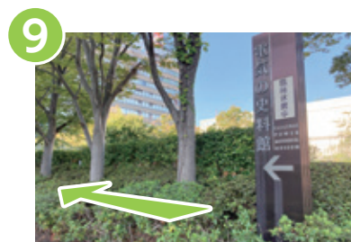
9 「電気の史料館←」の看板に沿って進みます。右手に経営技術戦略研究所の建物と紅白の鉄塔が見えます。